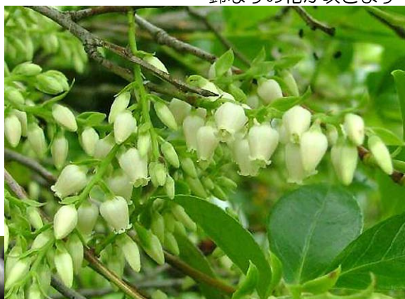
鈴なりの花が咲きます