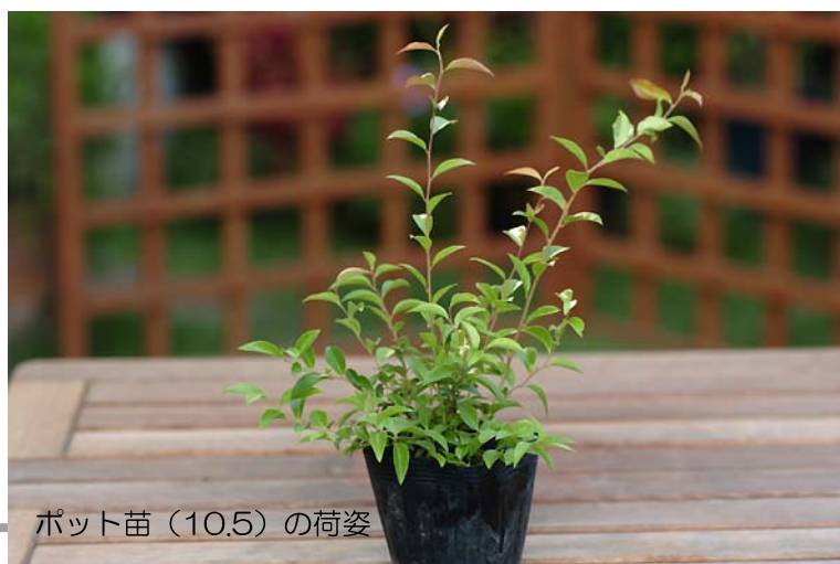
ポット苗 (10.5) の荷姿